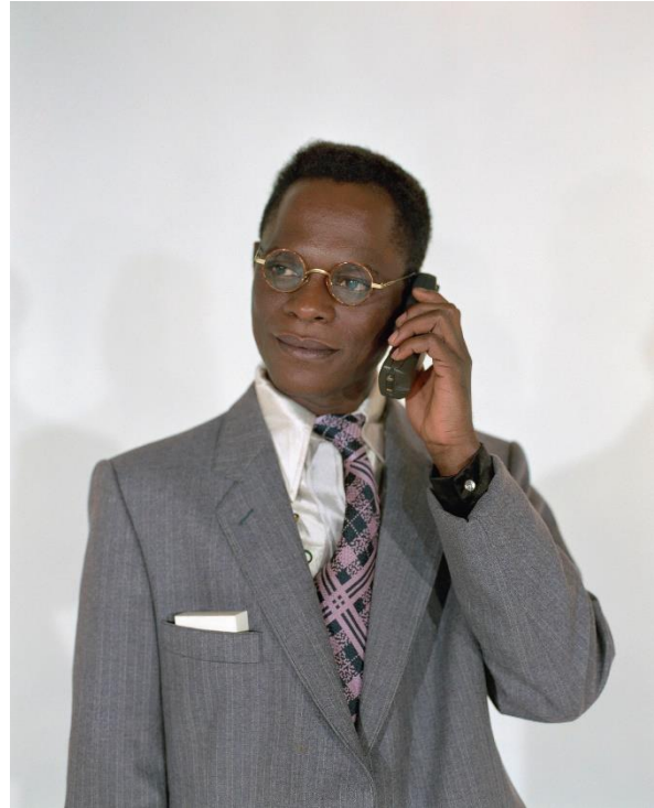
Samuel Fosso, Autoportrait – Serie « Tati », Le business man 1997 125x100 cm