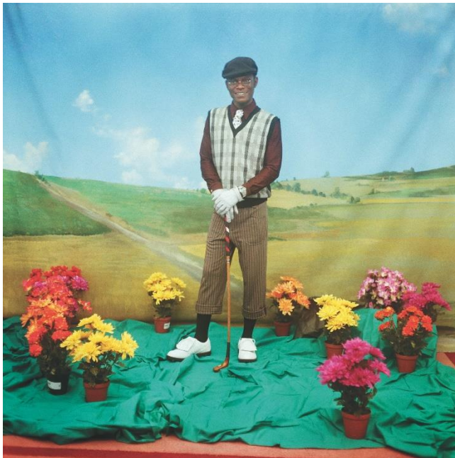
Samuel Fosso, Autoportrait – Serie « Tati », Le golfeur 1997 100x 100 cm

L'image la plus iconique de la série est sans doute La femme américaine libérée des années 70 , symbole de la contribution féminine au mouvement des droits civiques aux Etats-Unis. Vêtue d'un costume en patchwork aux couleurs vives se fondant harmonieusement avec le sol recouvert de tissu Tati, la femme fixe les spectateurs, à la fois affable et provocante. La transgression est à son comble avec La Bourgeoise , femme fatale, portant une fourrure, attribut de la réussite sociale.