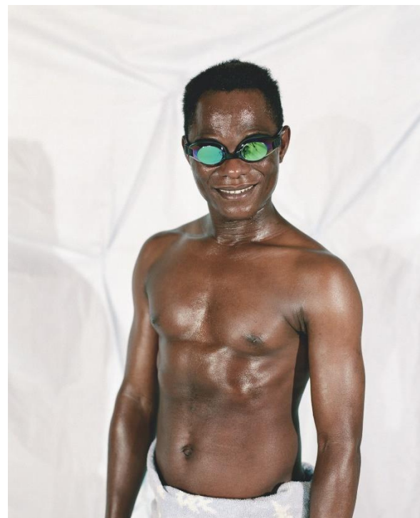
Samuel Fosso, Autoportrait – Serie « Tati », Le maitre-nageur 1997 125x100 cm