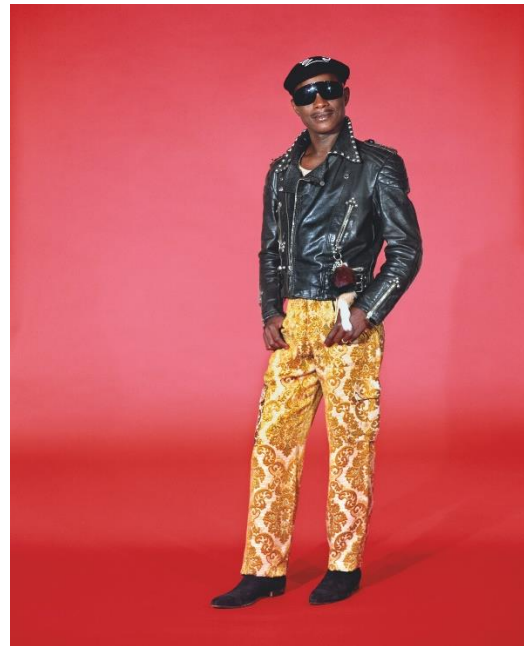
Samuel Fosso, Autoportrait – Serie « Tati », Le rockeur 1997 125x100 cm