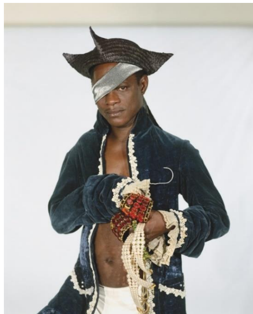
Samuel Fosso, Autoportrait – Serie « Tati », Le pirate 1997 125x100 cm © Samuel Fosso courtesy Jean-Marc Patras / Paris