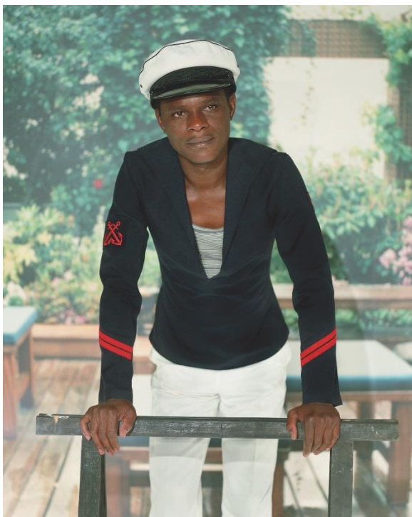
Samuel Fosso, Autoportrait – Serie « Tati », Le petit marin japonais 1997 125x100 cm