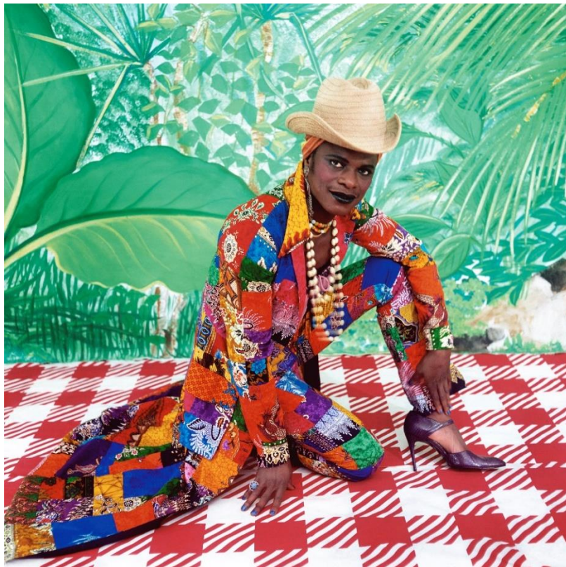
Samuel Fosso, Autoportrait Série « Tati », La Femme américaine libérée des années 70 , 1997 ©Samuel Fosso courtesy Jean-Marc Patras / Paris 100x100 cm