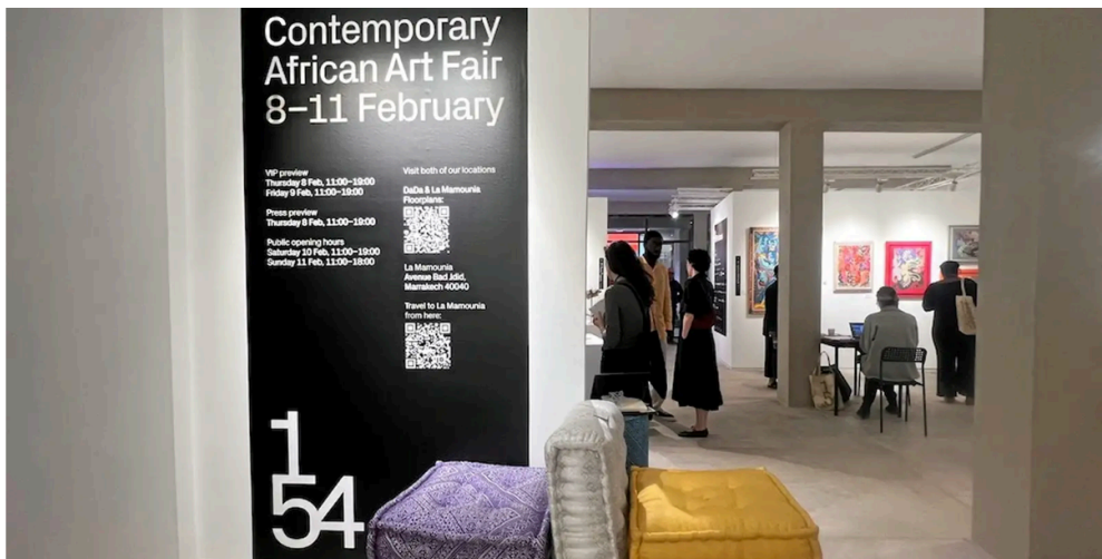
Une vue sur l'entrée du nouvel espace artistique DaDa, au cœur de la médina de Marrakech.