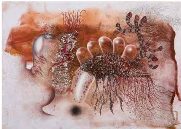
Thiémoko Claude Diarra, La récolte des trichomes , 2025, earth pigments on paper.

Des bronzes burkinabés aux colonnes gonflables, des pigments de terre aux corps au travail : notre sélection de galeries à suivre à Art Brussels 2026, entre découvertes africaines, figures féminines réhabilitées et gestes plastiques inattendus.