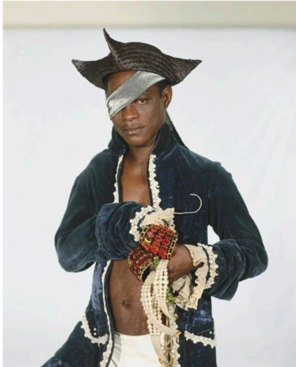
Serie TATI - Le pirate