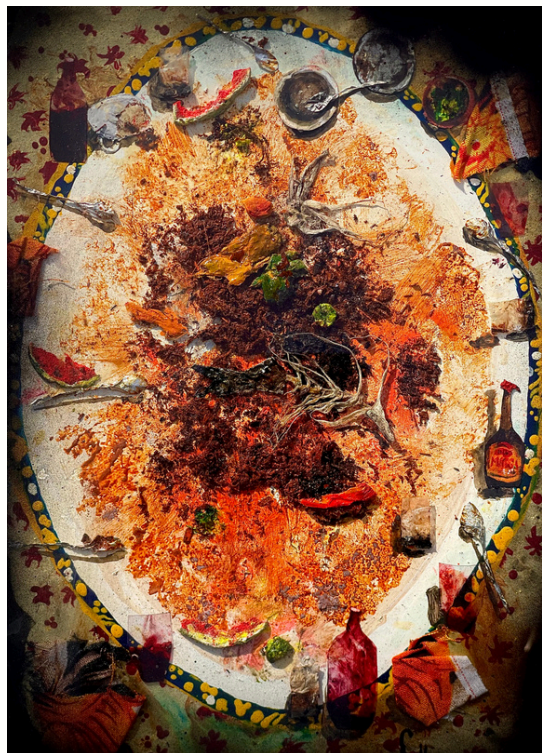
Le paysage des salléns, 2024 Technique mixte sous verre Mixed media and reverse painting on glass 30 x 20 cm