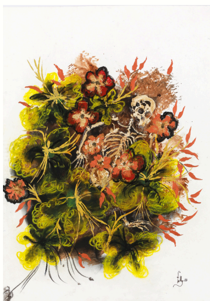
Les fleurs du bien, 2023 Technique mixte sur papier Mixed media on paper 49,5 x 35 cm