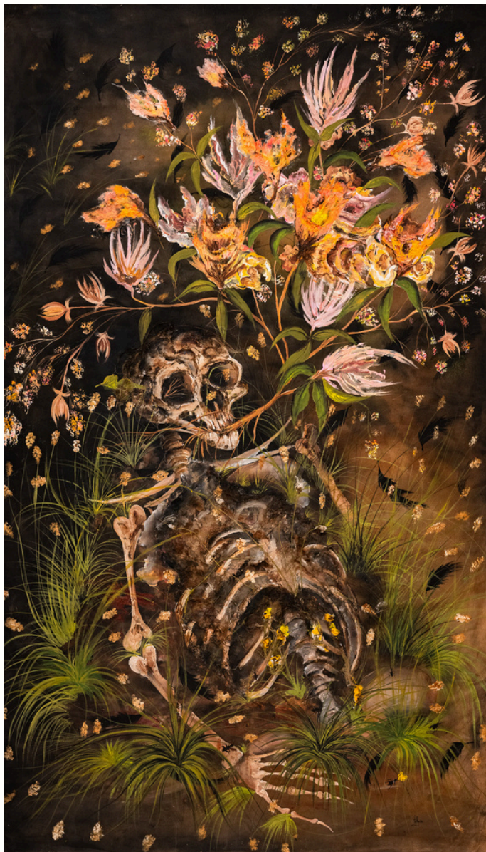
Corps généreux, 2023 Technique mixte sur toile Mixed media on canva 200 x 122 cm