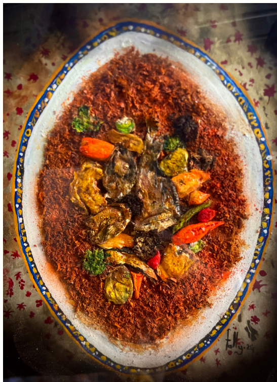
Ceebu Jën, 2024 Technique mixte sous verre Mixed media and reverse painting on glass 30 x 20 cm

Peinture sous verre / Reverse painting on glass