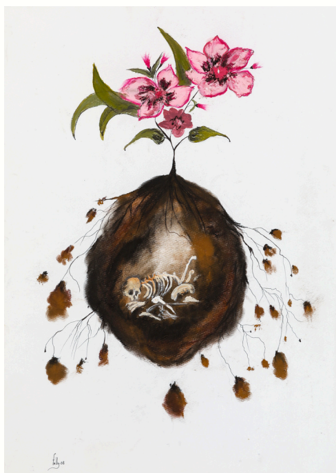
La recycleuse, 2023 Technique mixte sur papier Mixed media on paper 70 x 50 cm