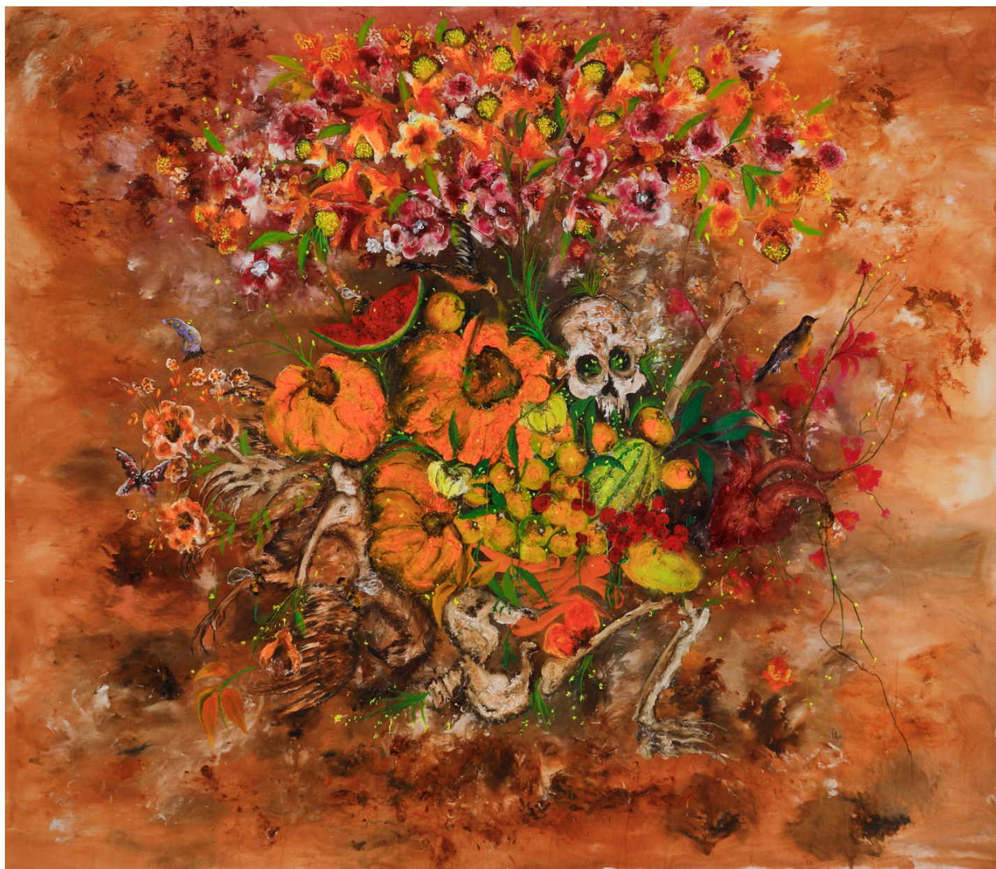
La germination des matières, 2023 Technique mixte sur toile Mixed media on canva 230 x 280 cm