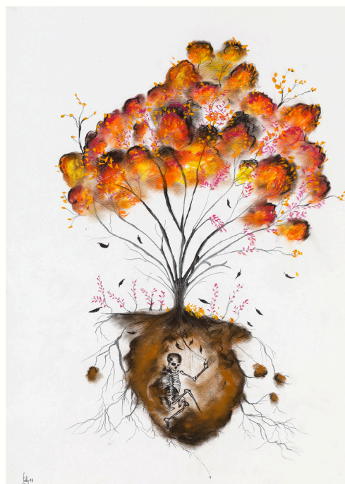
Le cycle, 2023 Technique mixte sur papier Mixed media on paper 70 x 50 cm