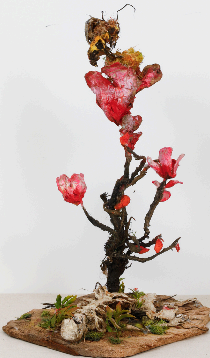
L'ascendant, 2023 Technique mixte 30 x 38 cm