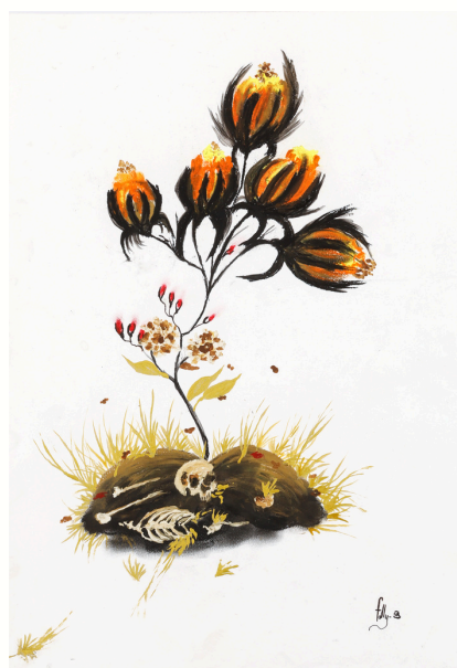
Sacrée souches, 2023 Technique mixte sur papier Mixed media on paper 49,5 x 35 cm