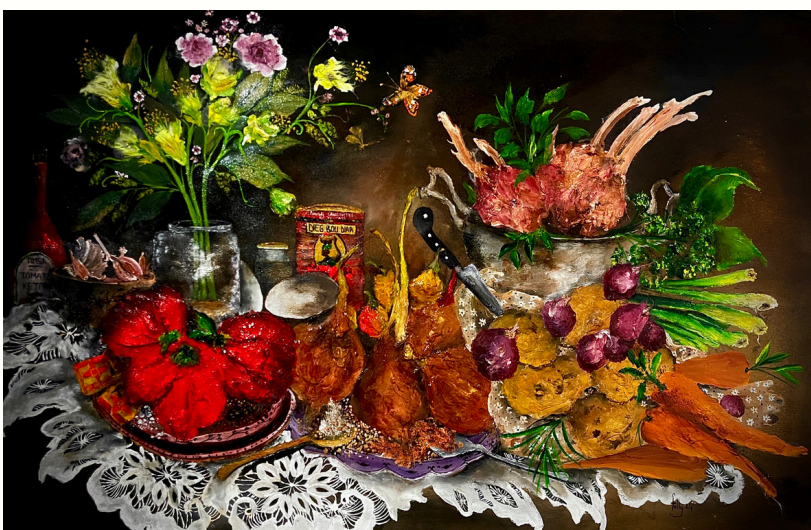
Les condiments d'un bon tiéré, 2024 Technique mixte sur toile Mixed media on canvas 60 x 100 cm