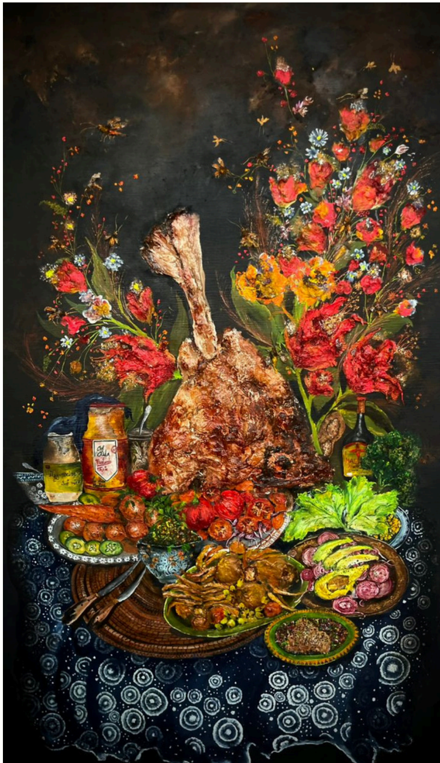
Les saveurs de la tabaski, 2024 Technique mixte sur toile Mixed media on canvas 180 x 100 cm