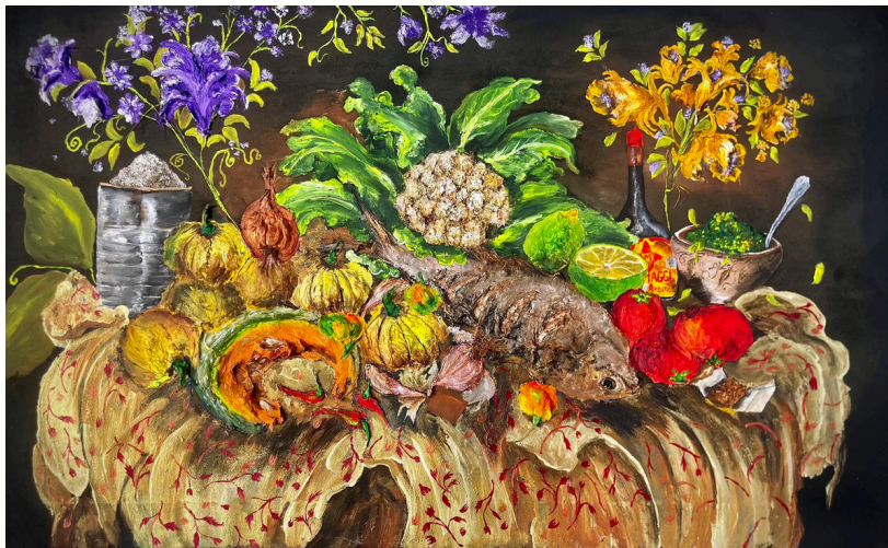
Ndougou Ceeb, 2024 Technique mixte sur toile Mixed media on canvas 60 x 100 cm

Using a multitude of materials applied to canvas, Fally Sène Sow, a self-taught artist, produces his works by composing with pigments, filasse, plastic and materials taken from the ground. These decomposing materials are a humus, a metaphor for the cycles of the soul and the carnal envelope, enabling her to create a flamboyant ecosystem like a Garden of Eden before the arrival of humanity. A form of reparation.