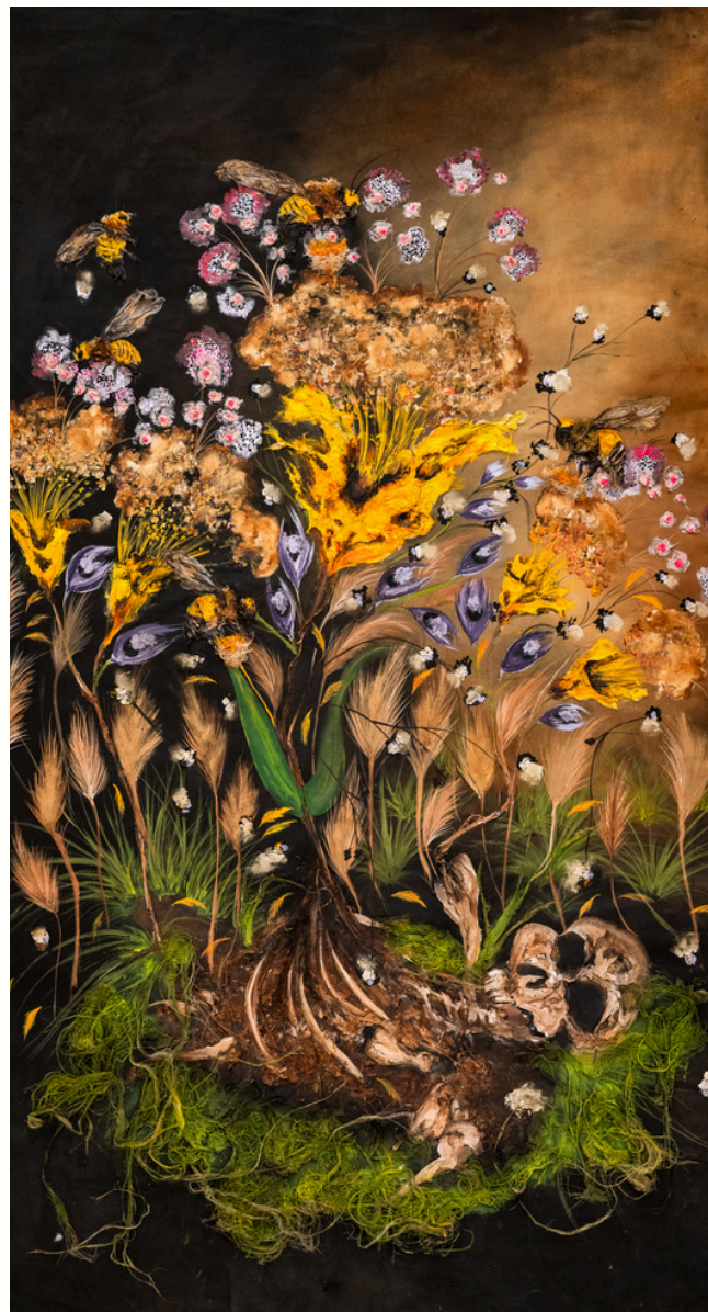
L'expression, 2023 Technique mixte sur toile Mixed media on canva 200 x 122 cm