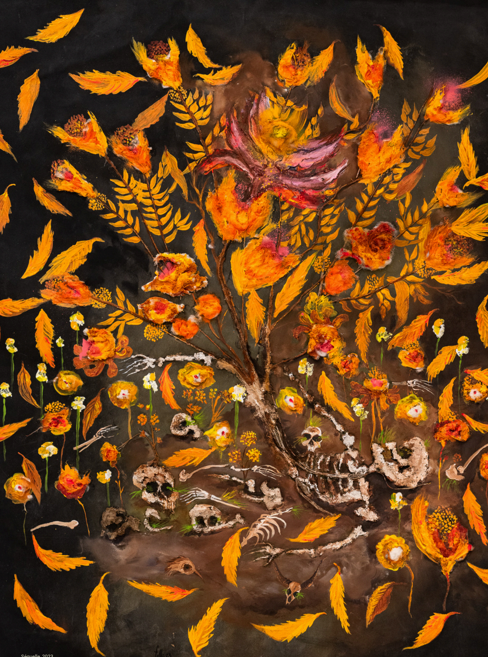
Séquelle, 2023 Technique mixte sur toile Mixed media on canvas 103 x 90 cm