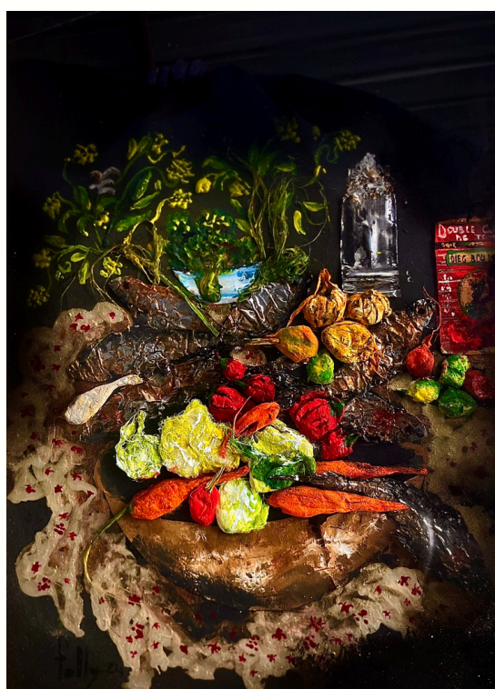
Rerou Sallen, 2024 Technique mixte sous verre Mixed media and reverse painting on glass 30 x 20 cm