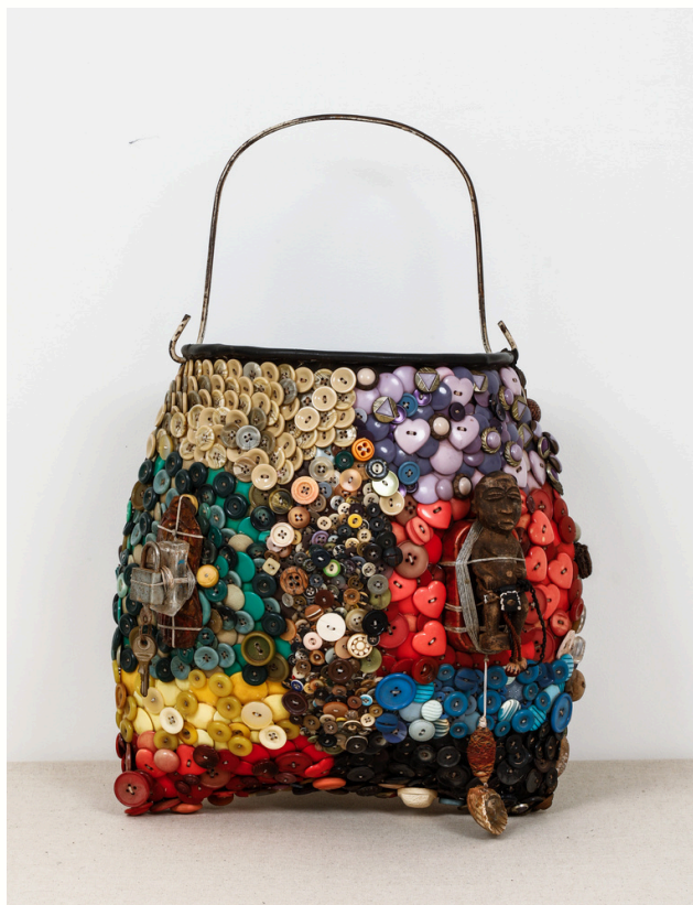
Sans titre (puisette) / Untitled (puisette), 2023

Boutons, cauris, coquillages, boîte de conserve, cadenas, fils, statuette en bois et métal sur chambre à air Buttons, cowries, shells, tin cans, padlocks, wires, wood and metal statuette on inner tube