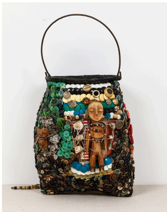
Sans titre (puisette) / Untitled (puisette), 2023

Boutons, fils, statuette en bois, pierre et perles sur chambre à air Buttons, threads, wooden statuettes, stones and beads on inner tubes