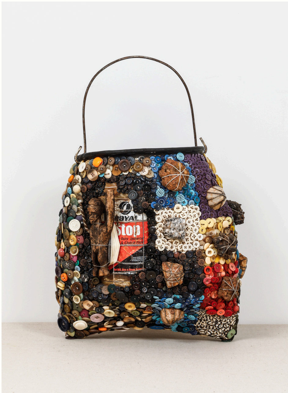
Sans titre (puisette) / Untitled (puisette), 2023

Boutons, bouteille en verre, clous en métal, pierres, cauris, perles, boîte de conserve, cadenas, fils, statuette en bois sur chambre à air