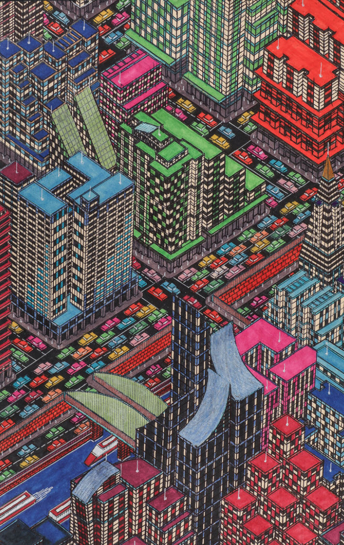
Mamadou CISSÉ, "Sans titre", 2023

Derrière cette fascination pour les lieux construits, se dissimule une foi dans le progrès. Mamadou Cissé croit en un futur meilleur aux conditions de vie plus agréables. Ses dessins exécutés au moyen de stylos et de feutres sont les manifestes de villes rêvées.