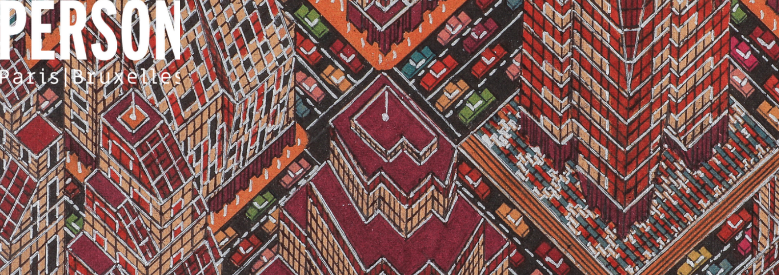
Ci-dessus : Mamadou CISSÉ, "Sans titre", 2023