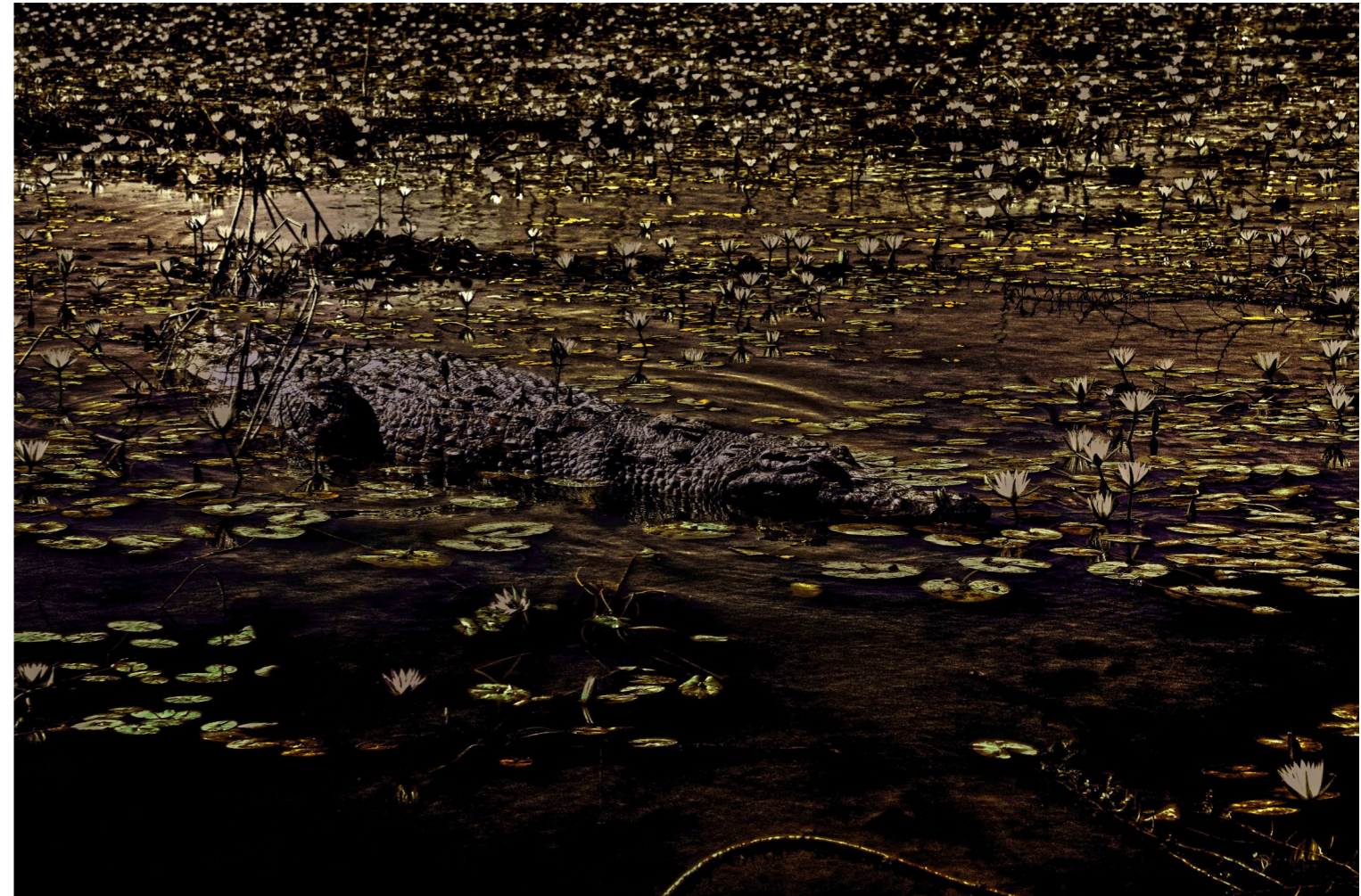
La spiritualité, la surréalité et le sacré, 2025 Photographie Fine Art Baryta Hahnemühle 70 x 100 cm Edition of 3 plus 2 artist's proofs