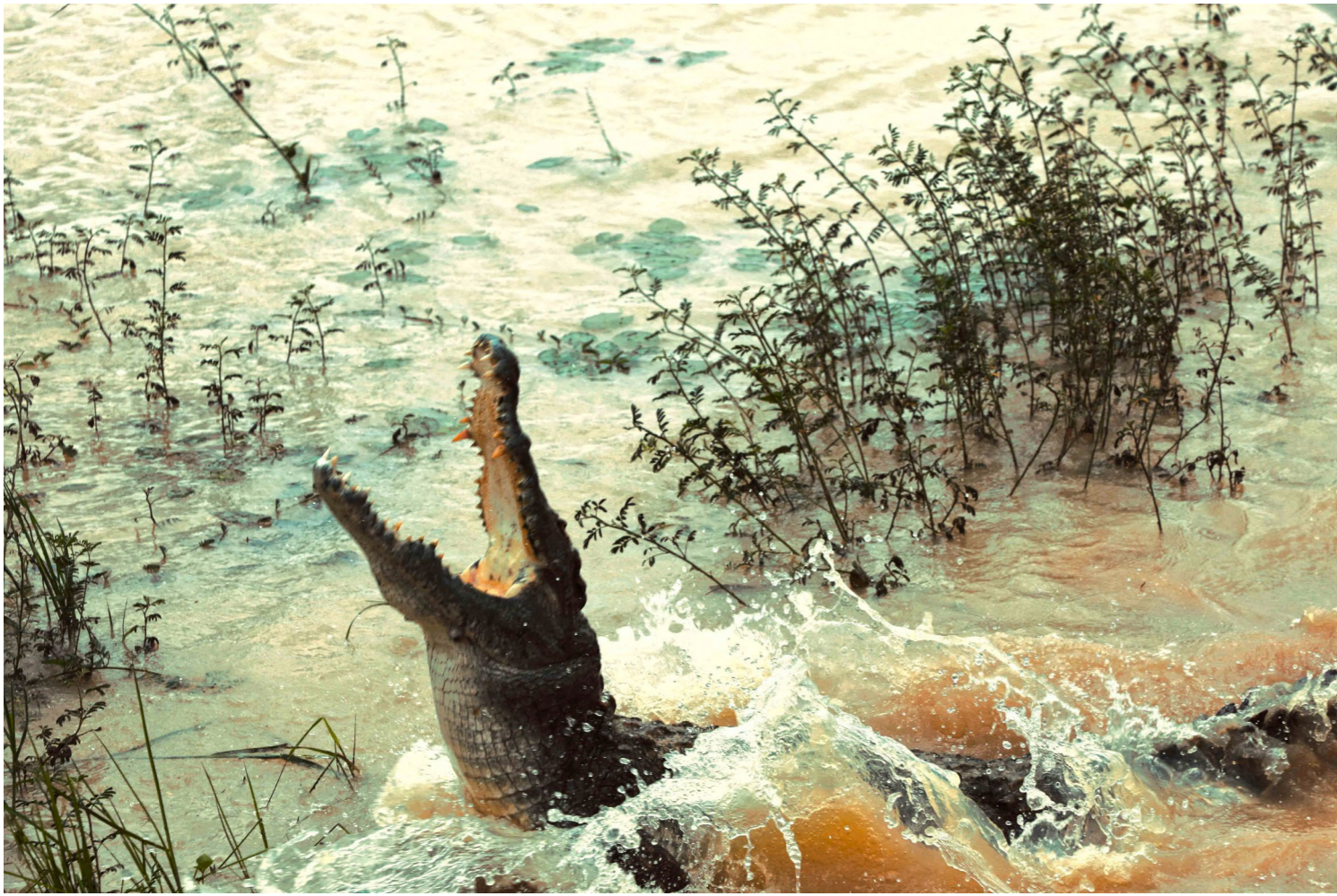
L'esprit et l'existence, 2025 Photographie Fine Art Baryta Hahnemühle 70 x 100 cm Edition of 3 plus 2 artist's proofs