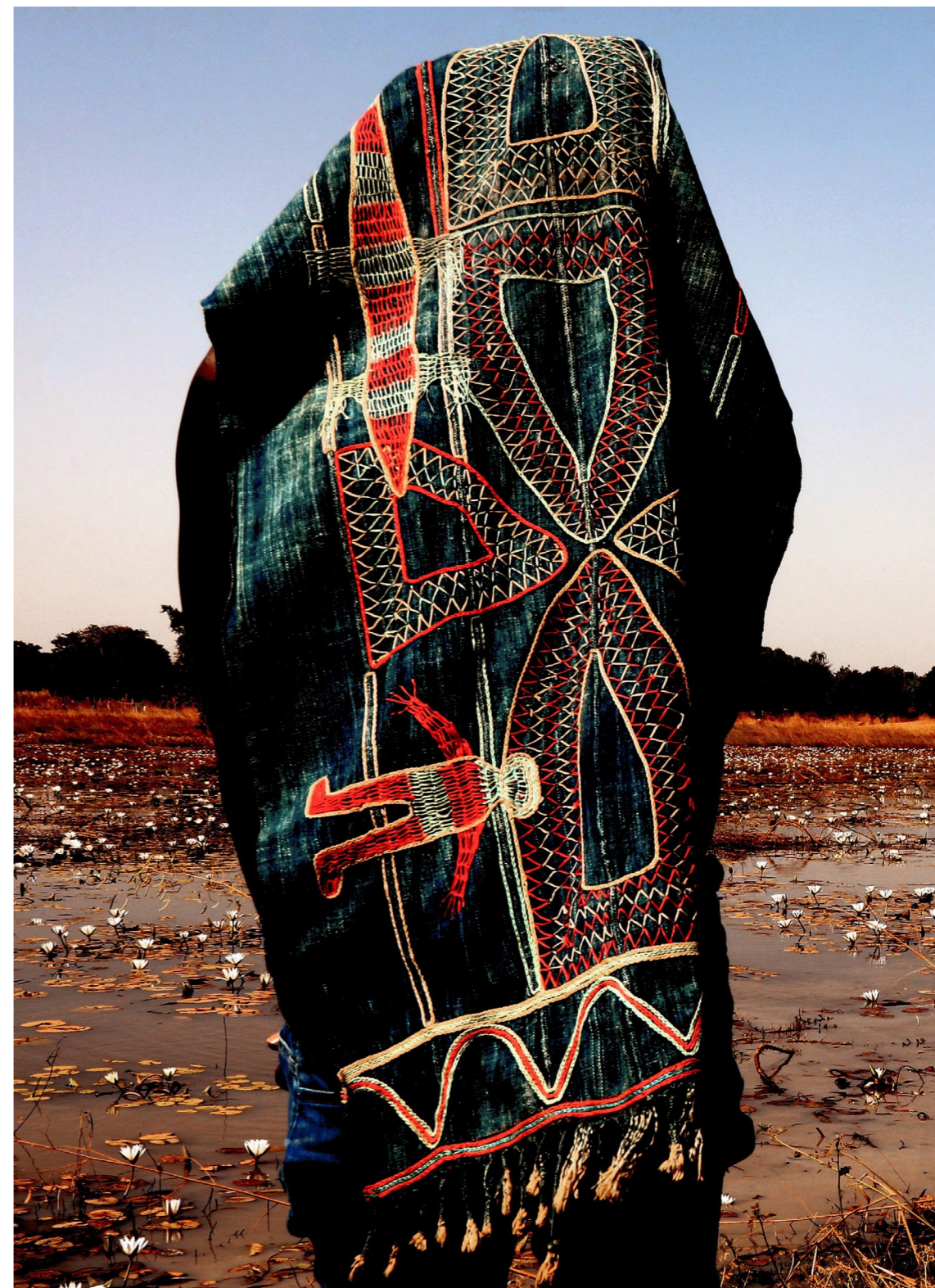
Le pagne de la fertilité, 2025 Photographie Fine Art Baryta Hahnemühle 100 x 70 cm Edition of 3 plus 2 artist's proofs