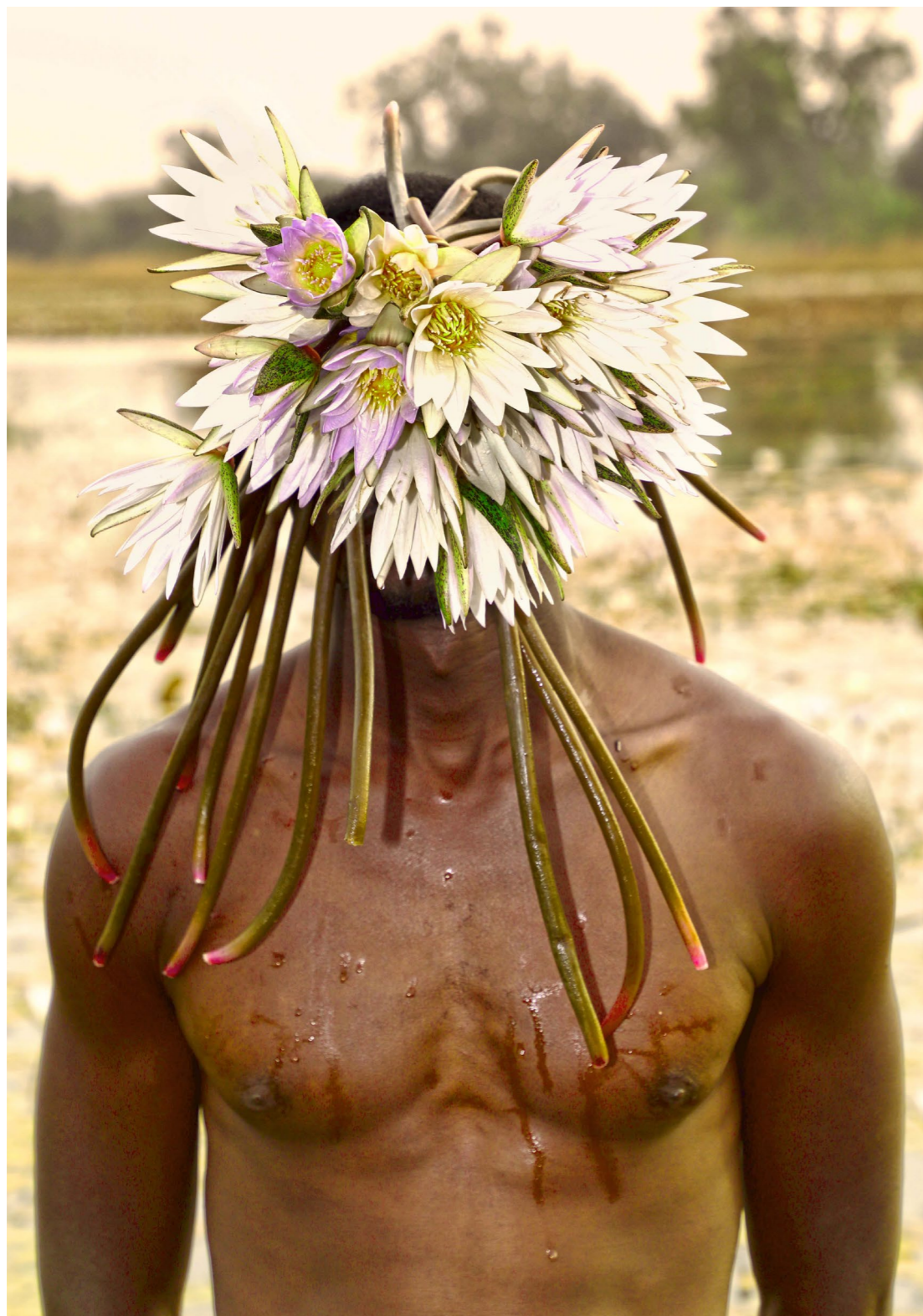
L'homme et les fleurs de nénuphars de la mare Bazoule, 2025 Photographie Fine Art Baryta Hahnemühle 100 x 70 cm Edition of 3 plus 2 artist's proofs